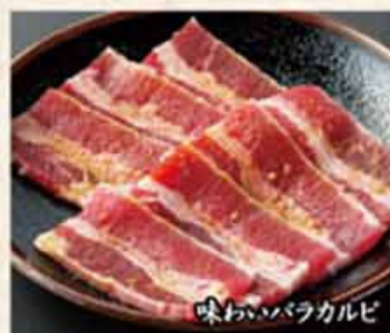
味わいバラカルビ