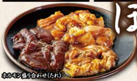
ホルモン盛り合わせ(たれ)