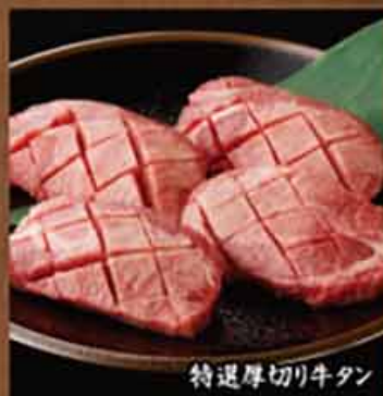
特選厚切り牛タン