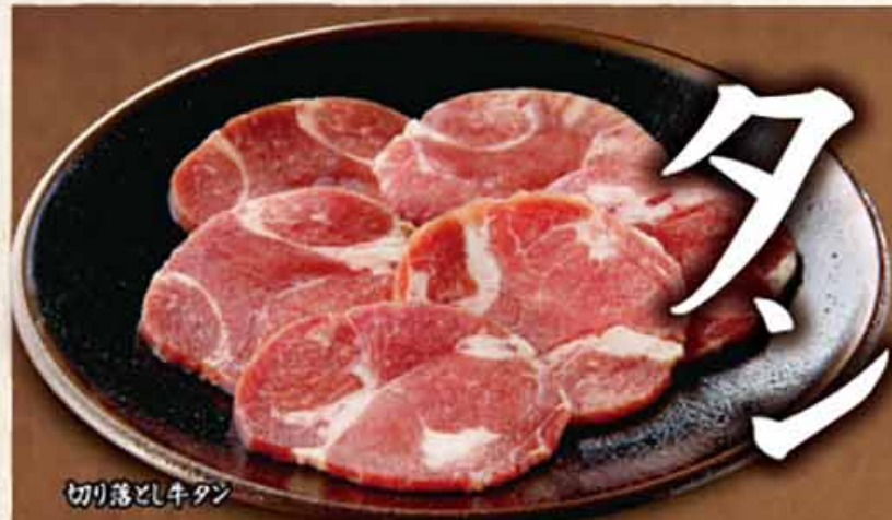
切り落とし牛タン