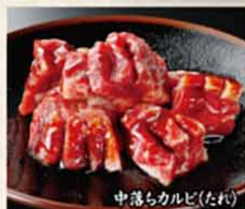
中落ちカルビ(たれ)