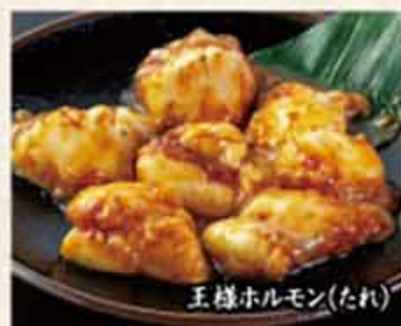
王様ホルモン(たれ)

※牛タン、ネギ塩牛タン、梅だれ牛タン、豚タン、ネギ塩豚タン、梅だれ豚タン、切り落とし牛タンは、肉の形を整える加工を施しています。