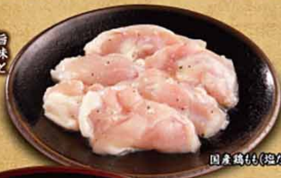
国産鶏もも(塩だれ)