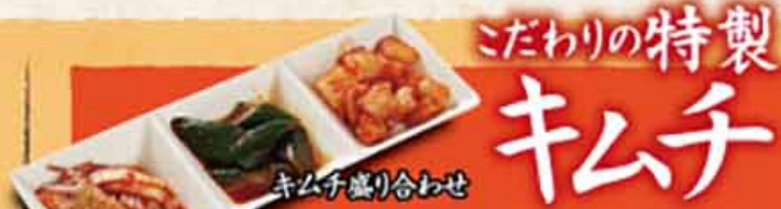
キムチ盛り合わせ