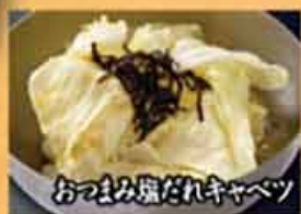
おつまみ塩だれキャベツ