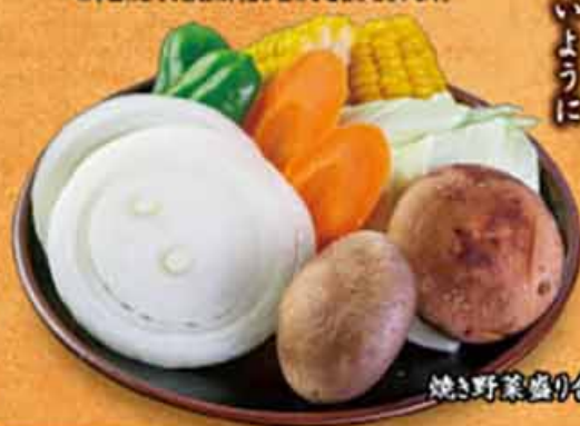
焼き野菜盛り合わせ