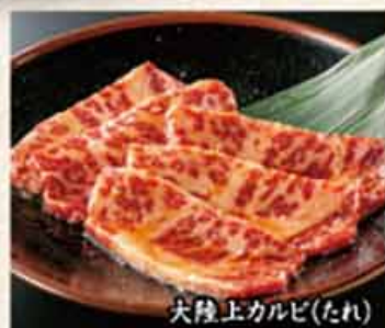
大陸上カルビ(たれ)